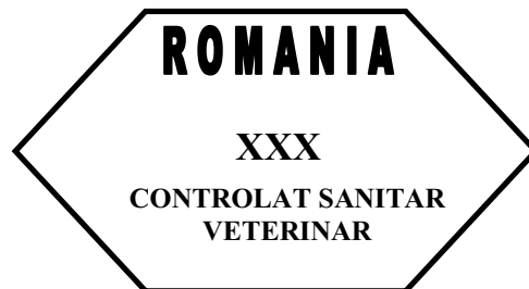
Figura nr. 3

Modelul*) mărcii de sănătate/identificare pentru carnea proaspătă de porc, carnea tocată, carnea preparată sau produsele din carne de porc ori care conțin carne de porc provenită de la porcinele domestice crescute în exploatații care nu îndeplinesc prevederile art. 4 lit. (a) și (b) din Decizia 2013/764/UE, precum și în cazul cărnii proaspete de mistreț, utilizată numai pe teritoriul României